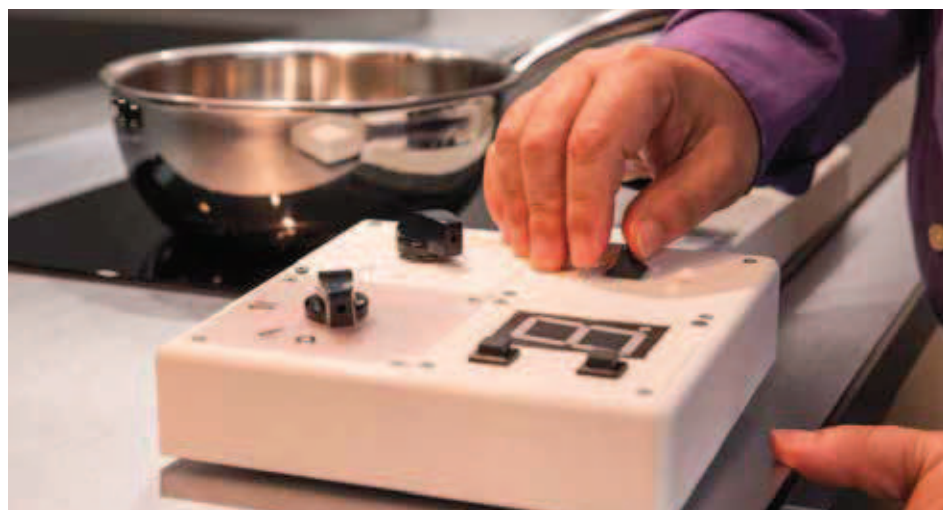
L'appareil se fixe sur le plan de cuisson vitrocéramique ou à induction.